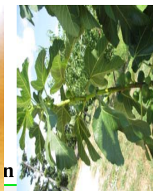
années 2011 Dauphine