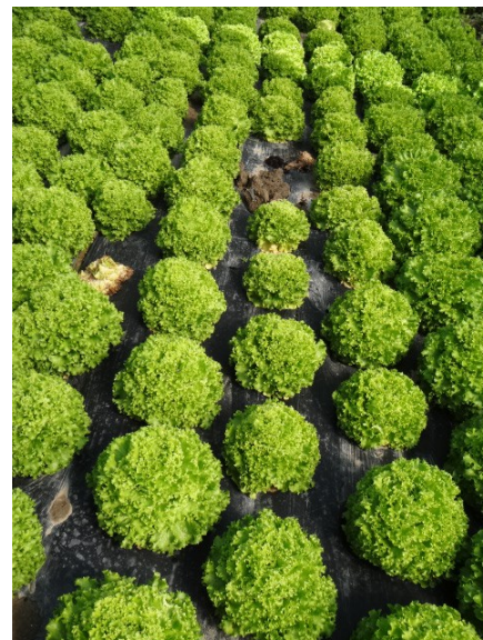
Hétérogénéité de la culture - 17 mars

Nous n'avons donc pas réalisé de mesures de rendement sur cet essai largement compromis par les problèmes cultureux.