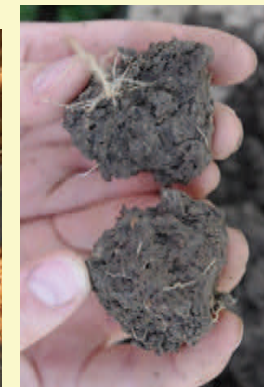
Figure 6 : Observer l'état interne des mottes.