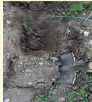
Figure 2 : Prédécouper le volume de sol à analyser