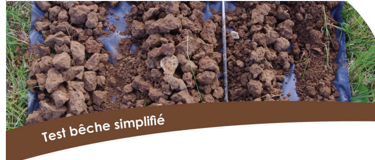
Test bêche simplifié

La structure du sol est une composante clé de la fertilité. Elle joue un rôle sur la circulation de l'eau, de l'air et de la chaleur et aussi un rôle de support des cultures via le développement racinaire des plantes. La structure du sol est en perpétuelle évolution sous l'influence du climat, de la faune et de la flore du sol ainsi que de l'activité agricole (pneumatiques d'engins et outils de travail agricole). Il est important de la connaître et de la décrire afin de diagnostiquer son état et ainsi orienter les choix et les pratiques culturales (travail du sol, apport de matière organique...). Étudié dans le cadre du projet SolAB, le test bêche permet de suivre la structure du sol.