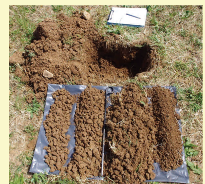
Figure 7 : Estimer la proportion de cailloux, de terre fine et de chaque type de motte.