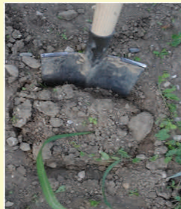
Figure 1 : Creuser la prétranchée