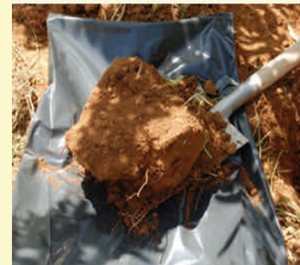
Figure 4 : Observer la tenue de la bêche sur la bêche puis sur la bêche