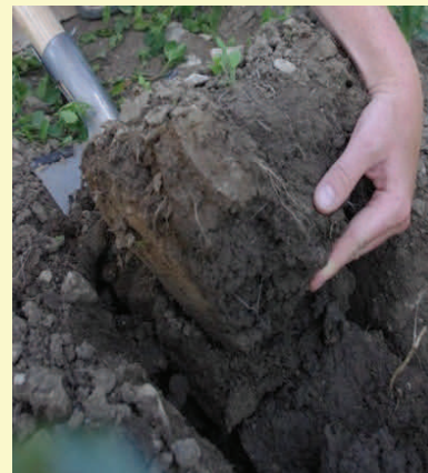
Figure 3 : Prélever la bêche de sol