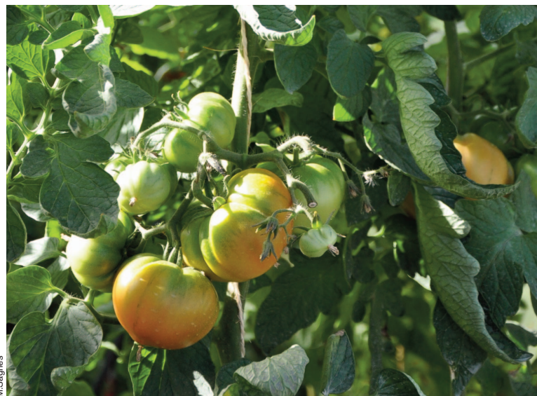
Autre essai variétal conduit par le GRAB, celui sur tomates disponibles en semences biologiques ou conventionnelles non traitées, en culture de printemps sous tunnel froid. Quatre Cœur de bœuf sont comparées au témoin Coralina, et cinq Marmande au témoin Marbonne.