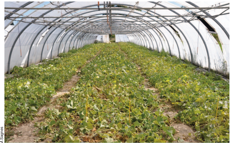
Le Grab poursuit ses essais « produits » contre l'oïdium sur melon.