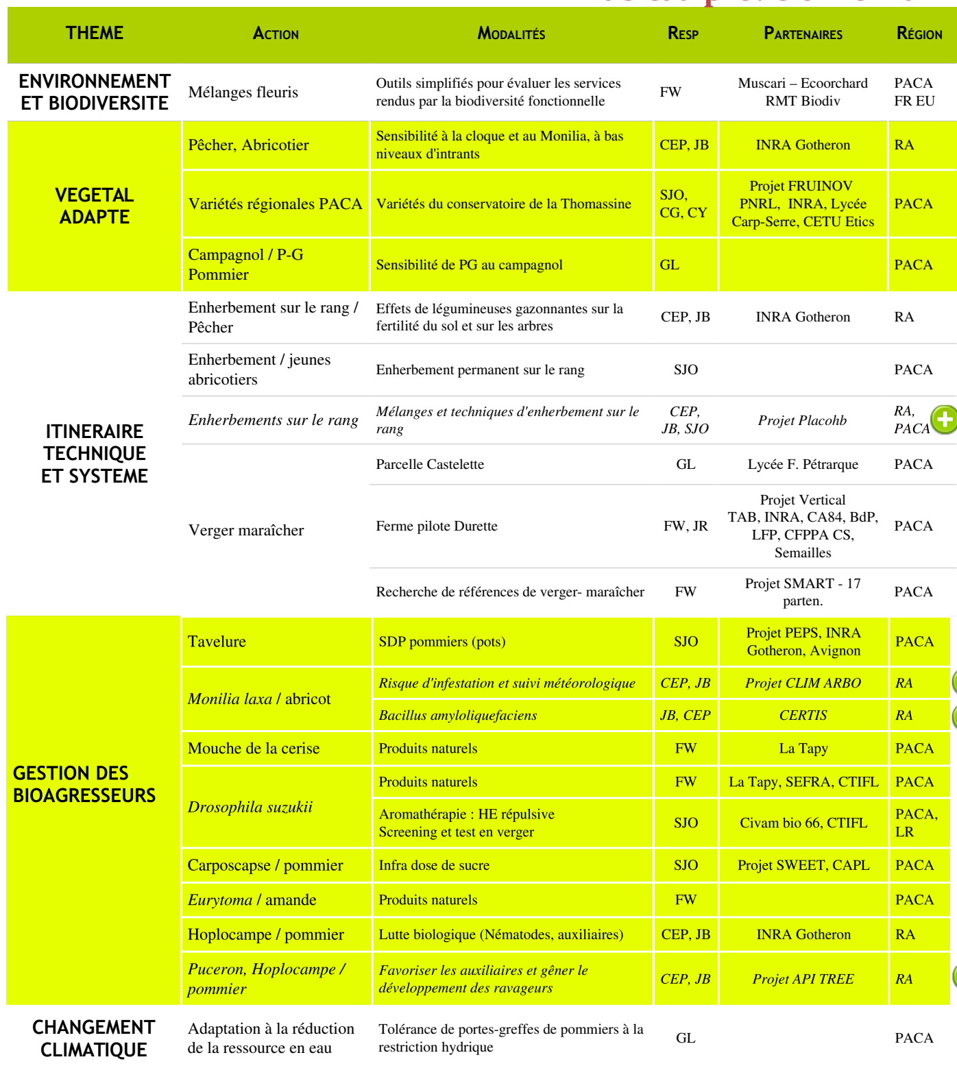
Tableau prévisionnel 2017