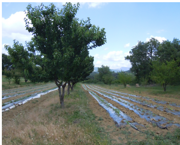
2011 : Visites, conception et lancement de systèmes associant fruits et légumes