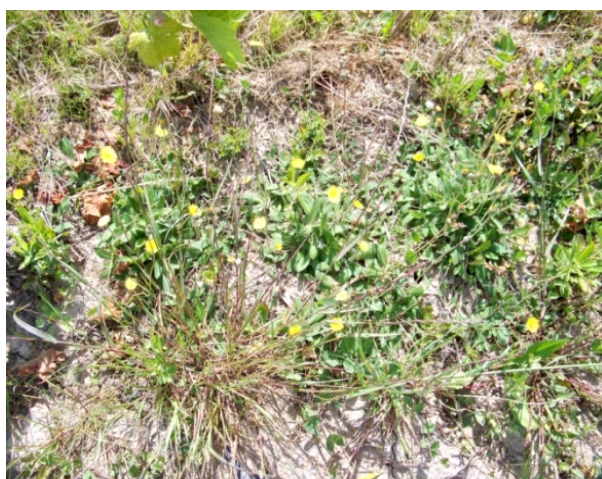
Piloselle en cours d'implantation

En alternative à l'entretien mécanique du rang, un essai d'enherbement a été mis en place sur une parcelle du Lycée agricole François Pétrarque. La couverture végétale testée est l'épervière piloselle ( Hieracium pilosella ), plante vivace se propageant par stolons, peu concurrentielle pour la vigne (masse végétative réduite) et possédant des qualités allélopathiques.