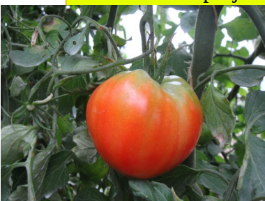
120 variétés de tomates évaluées

Ce travail est réalisé en étroite collaboration avec les maraîchers bio et avec des instituts (Ctifl, ITAB), des stations d'expérimentation (APREL, IBB...) et des sociétés de semences. Il s'insère aussi dans des projets européens (SOLIBAM, ALCOTRA), nationaux ou régionaux.