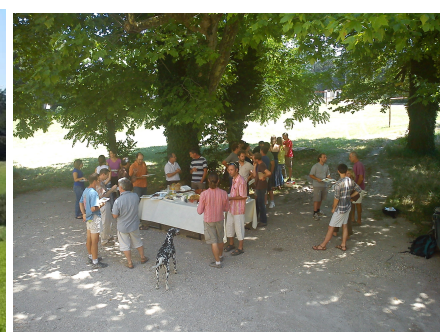
Juin : agriculteurs / systèmes