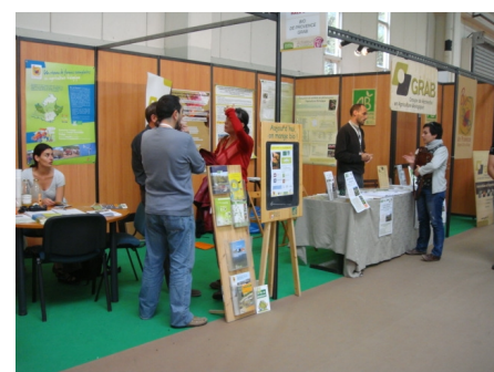
Octobre : Miffel stand et conf.