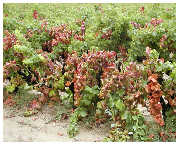
Forte attaque de Flavescence Dorée

La terre à Diatomées, testé l'an dernier, a été abandonnée de part sa efficacité nulle et son agressivité vis à vis du matériel de pulvérisation.