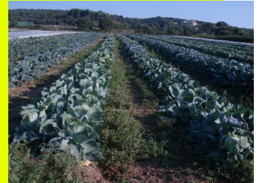
Choux en plein champ (2011)

Depuis 2000, le GRAB évalue le comportement en culture bio des variétés pour leur adaptation à différents créneaux de production (calendriers variés, productions sous abris et plein champ). L'objectif est notamment de garantir un approvisionnement régulier et diversifié de légumes de bonne qualité gustative, en privilégiant des variétés disponibles en semences biologiques.