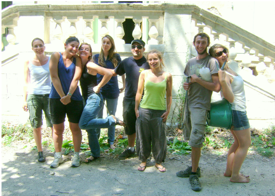
Sciences et bonne humeur... Une partie de l'équipe 2011 des stagiaires du GRAB