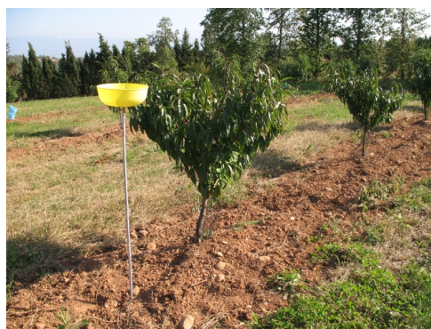
Piège bol jaune pour insectes volants