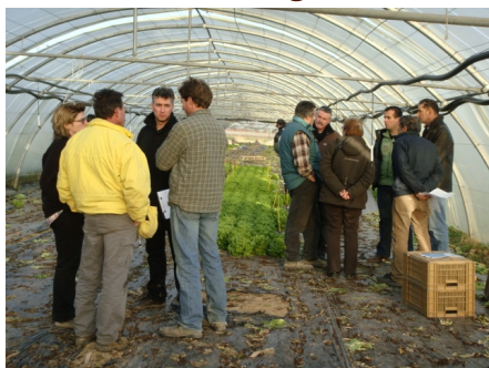
Janvier : visite essais salades