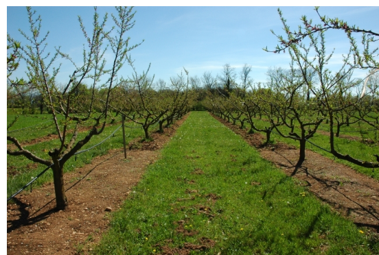
Semis de trèfle blanc en verger de pêchers Bénédicté

Un nouveau semis de trèfle a été réalisé en mars 2011. En février 2011 (trèfle non semé à cette date), la densité de vers de terre épigés et endogés était supérieure dans la modalité enherbée. Cette différence peut être expliquée par deux hypothèses : (1) le travail du sol a entraîné une fuite de vers de terre épigés et (2) la matière organique morte plus abondante dans la modalité enherbée exerce un effet attractif sur les vers de terre endogés. Le suivi de la disponibilité en eau du sol entre avril et août met en évidence des variations de la teneur en eau du sol plus faibles dans la modalité enherbée. Ceci suggère un effet tampon de l'enherbement. Une plus forte densité d'araignées a été observée dans la modalité enherbée. En revanche, aucune différence de densité de Carabes et Staphylyns n'a été mise en évidence. Même si la fertilisation a été deux fois plus faible sur la modalité totalement