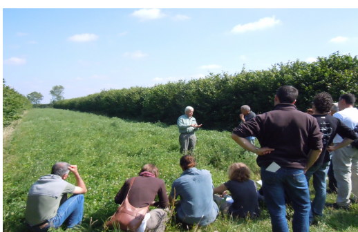
Juillet : visite Agroforesterie (R. Uni)