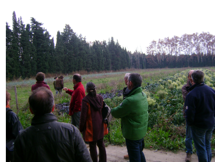
Décembre : JT FetL bio (Rennes)