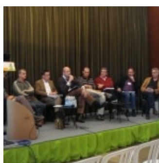
Septembre : Tech & Bio