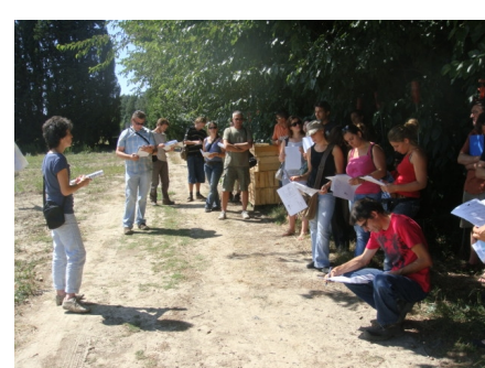
Juillet : visite essais station