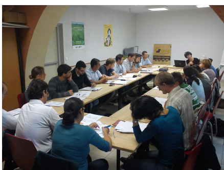
Octobre : Commissions GRAB