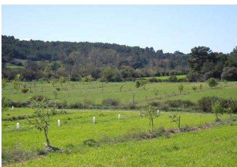
Avril : visite Agroforesterie (34)