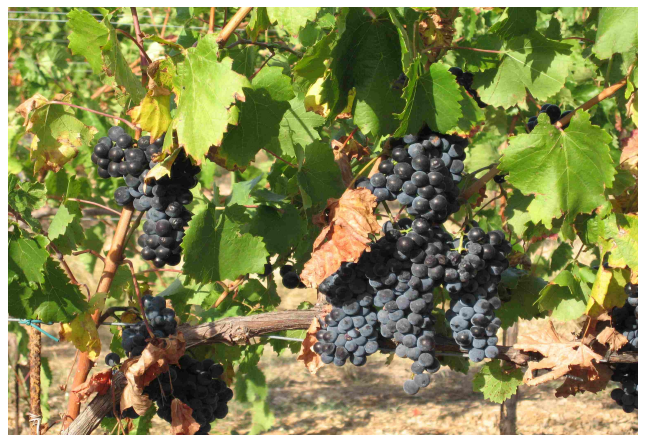
Variété n°648 / Inra de Bordeaux