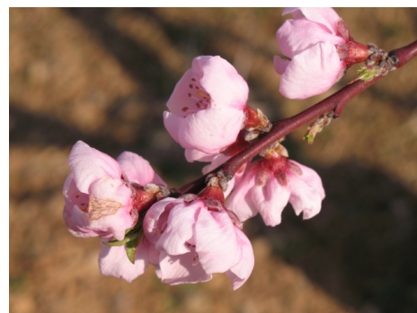
Nécrose due au Monilia sur fleur

Sur abricotiers, le Monilia laxa se développe sur rameaux, fleurs et fruits, provoquant de lourdes pertes dans les vergers infestés. Dans l'objectif de trouver des méthodes alternatives à l'utilisation du cuivre et du soufre, des traitements isothérapeutiques sont testés depuis 2007. Quatre dilutions (2DH, 4DH, 8DH, 12DH) sont comparées à un témoin non traité et une référence à base de cuivre. L'essai est mené sur deux variétés différentes: Modesto et Goldrich. Les conditions météorologiques de l'année ont été très favorables au développement du monilia sur fleurs et aucun traitement isothérapeutique ou cuprique n'a permis de limiter de façon satisfaisante le champignon