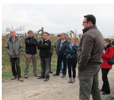
Novembre : JTE légumes bio