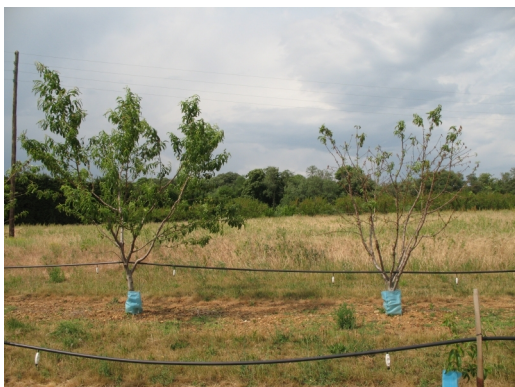
Sensibilité de pêchers : Coraline / Royal Pride

Des variétés commerciales (Bénédicté, Ivoire, Onyx), anciennes (Reine des Vergers, Belle de Montélimar) ou plus récentes (Whitered, Bellerime, Coraline, Royal Pride) ont été plantées en 2008 à l'Inra de Gotheron afin d'évaluer leur sensibilité aux bioagresseurs. La pression de contamination par la cloque a été très intense en 2011 sur la parcelle expérimentale. L'intensité des dégâts a été très forte sur l'ensemble des variétés testées dans le dispositif à l'exception du témoin (variété Bénédicté). Les observations réalisées en 2009, 2010 et 2011 montrent que le gradient des différences de sensibilité variétale diminue lorsque la pression augmente. Les variétés les moins sensibles sont Bénédicté, Reine des Vergers et Belle de Montélimar. La variabilité de la sensibilité aux monilioses sur fleur est faible. Les observations sont à poursuivre afin de confirmer ou non ces observations. Une évaluation de la reprise de la croissance végétative après les dégâts sévères cumulés de cloque et de monilioses a mis en évidence différents niveaux de résilience.