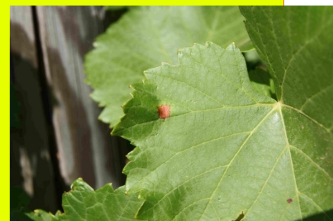
Tâches nécrosées de mildiou sur Bx 794

Les différentes variétés ont été vinifiées en rosé au Centre de Recherche sur les Vins Rosés à Vidauban. Les résultats montrent que les vins obtenus à partir des 3 variétés tolérantes, candidates à l'inscription, présentent de bonnes qualités visuelles et organoleptiques. Ils n'ont pas le caractère attendu des vins rosés de Provence, mais offrent des aptitudes œnologiques très encourageantes qu'il faudra étudier en introduisant ces différents génotypes dans des assemblages.