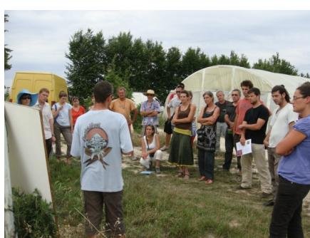
Juin : Visite bandes fleuries