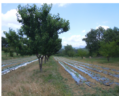
Avril : visite Agroforesterie (34)