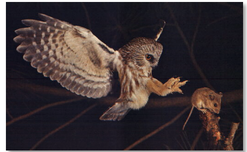
Chouette hulotte en train de chasser.